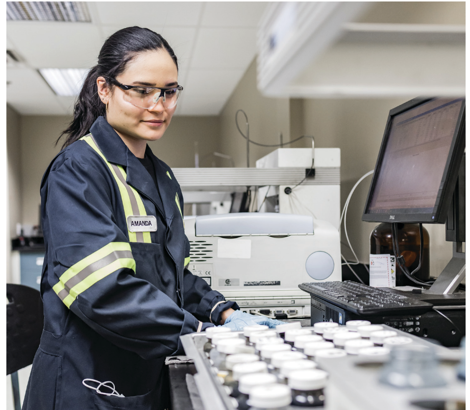
Les services de laboratoire de Toromont analysent l'huile de machine à la recherche de contaminants nocifs qui dégradent les performances et endommagent les pièces d'usure.

Cette combinaison de capacités contribue de plus en plus aux objectifs de durabilité de nos clients et les aide à gérer leur coût total de propriété. En 2023, les revenus du service après-vente ont augmenté de 11 % d'une année sur l'autre et ont représenté 43 % des revenus totaux. Avec nos différents partenaires fabricants d'équipements d'origine, nous nous concentrons sur l'offre d'un portefeuille de solutions de services qui ne cesse de s'étoffer.