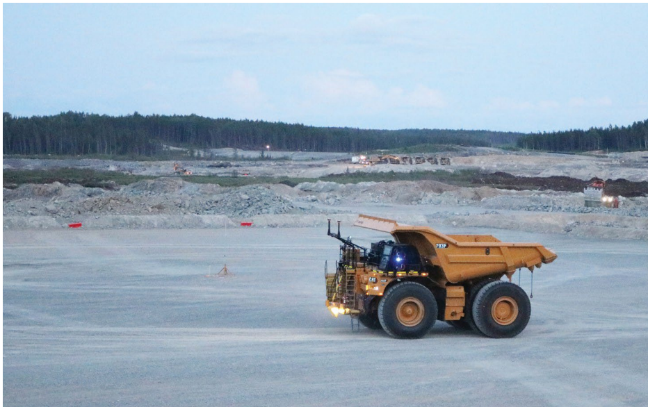
Un camion de transport autonome Cat® Command 793F en service au projet Côte Gold d'IAMGOLD dans le nord de l'Ontario.

Caterpillar est un leader mondial dans la conception et la construction de camions miniers entièrement autonomes équipés des solutions Cat MineStar MC . Ces machines ont transporté plus de sept milliards de tonnes de matériaux dans le monde entier dans le cadre d'une flotte établie qui comprend désormais des machines dans les territoires de Toromont. À mesure que le développement des véhicules autonomes s'accélère dans le secteur minier et dans d'autres industries, les machines peuvent être exploitées avec une efficacité optimale et les événements de temps d'arrêt causés par l'opérateur peuvent être réduits, contribuant ainsi à la baisse des émissions de carbone des groupes motopropulseurs à moteur diesel existants. Les machines autonomes sont programmées pour imiter les compétences de conduite avancées d'opérateurs expérimentés, ce qui renforce la sécurité des personnes et des équipements auxiliaires sur un site.