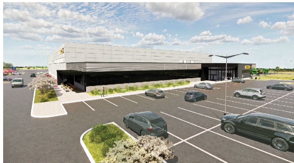
Une représentation artistique du nouveau centre de remise à neuf de Toromont, qui ouvrira ses portes au deuxième trimestre 2024 à Bradford, en Ontario.

En 2023, le ratio des revenus générés par les composants réusinés par rapport aux ventes totales de pièces a augmenté de 12 % par rapport à 2022, car nos clients ont adopté les fonctionnalités de Toromont. Pour répondre à la demande de nos clients, nous ouvrirons un centre de remise à neuf de 143 000 pi 2 à Bradford, en Ontario, au cours du deuxième trimestre de 2024. Cette installation de 70 millions de dollars renforcera notre capacité et notre efficacité en tant que contributeur à l'économie circulaire, et ce, grâce à des contrôles environnementaux et de contamination avancés, notamment une station robotisée de nettoyage au bicarbonate de soude. Le décapage au bicarbonate de soude est une solution de rechange écologique au nettoyage caustique avant le démontage. De l'eau recyclée sera utilisée pour refroidir les moteurs pendant les essais dynamométriques en circuit fermé. Un système thermique CIMCO contrôlera la température et l'humidité dans l'installation. Ce système utilisera un fluide frigorigène naturel sans PRC et permettra d'améliorer l'efficacité énergétique d'environ 30 % par rapport aux équipements conventionnels. Au moment de sa mise en service, l'usine emploiera 160 personnes, la majorité d'entre elles étant transférées des installations voisines.